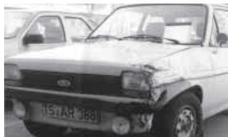
Unfall auf einer Dienstreise: In der Regel haftet der Dienstgeber

Diese Grundregeln gelten auch für den Kfz-Bereich, allerdings nur für den am