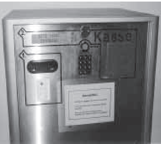
Nebenkosten wie z. B. Parkgebühren werden extra erstattet.

Der Begriff der Nebenkosten ist rechtlich unbestimmt. Es handelt sich um Ausgaben, die zur Erledigung des Dienst-