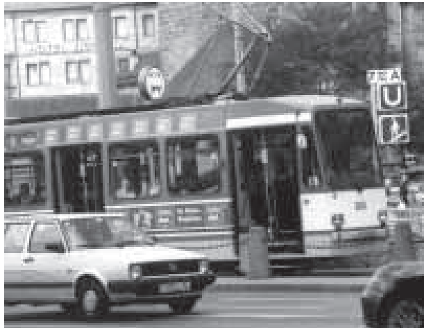
Im Einzelfall kann die Benutzung des eigenen Autos wirtschaftlicher sein.

Herr V. könnte zuerst von Penzberg aus nach München an seinen Dienstort fahren, um von dort die Dienstreise anzutreten. Es ist aber nicht notwendig, dass Herr V. die Dienstreise von München aus antritt. Da das Ziel der Dienstreise vom seinem Wohnort aus günstiger zu erreichen ist, hat Herr V. die Dienstreise von der Wohnung aus anzutreten (§ 7 ReiseKO). Reisekosten werden nur für