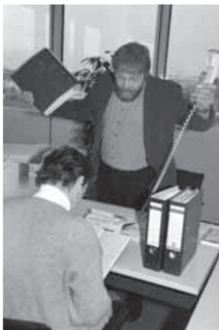
Selten aber möglich: Entlassung von Unkündbaren

Erschleichen von Arbeitsunfähigkeitsbescheinigungen durch eine vorgetäuschte Erkrankung einen "Unkündbaren" den Arbeitsplatz kosten. Ebenso können wie-