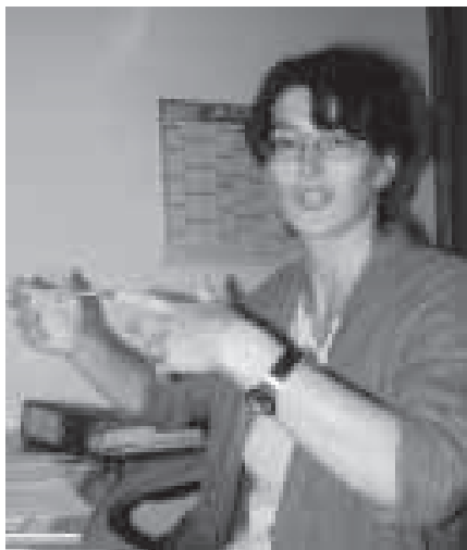
Mehr Eigenverantwortung kennzeichnet das neue Berufsprofil

erischen Bistümer? Zunächst schien die Forderung nach einem einheitlichen Berufsprofil nicht zu verwirklichen – zu groß schienen die Unterschiede zwischen den